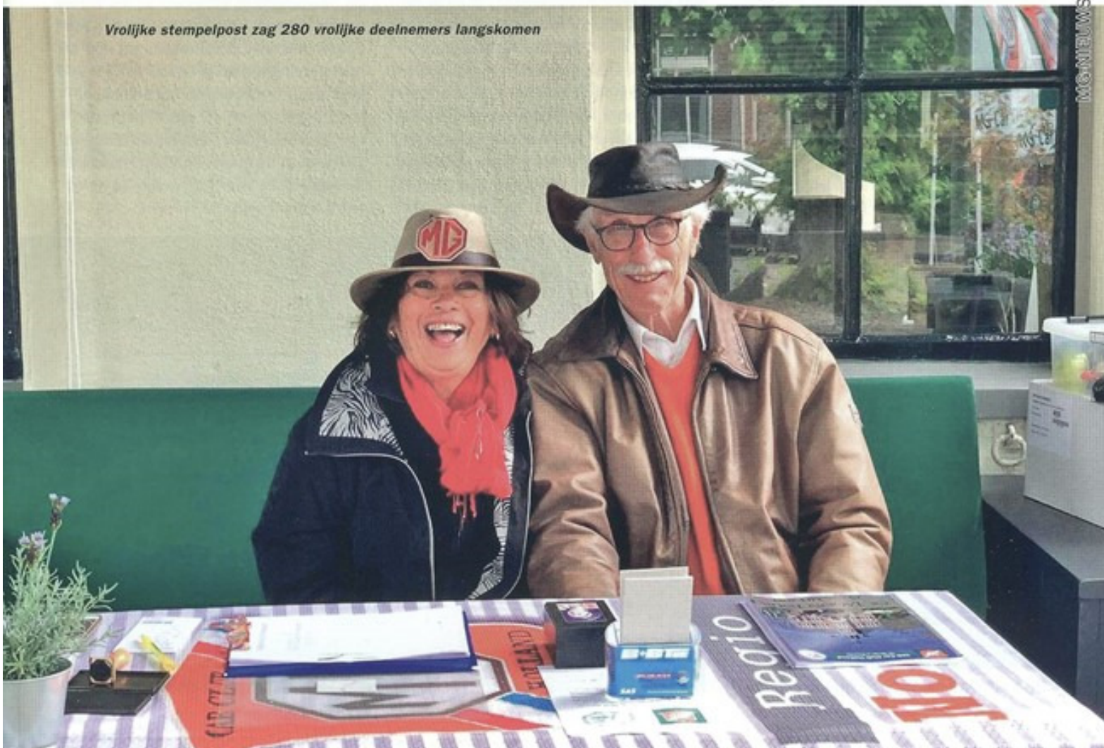
Vrolijke stempelpost zag 280 vrolijke deelnemers langskomen